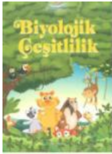
Biyolojik Çeşitlilik Dijital Dergi